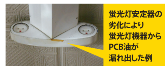
蛍光灯安定器の劣化により 蛍光灯機器から PCB油が 漏れ出した例