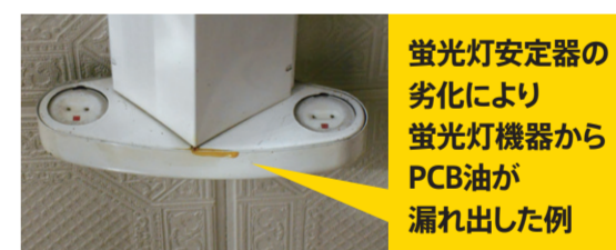
蛍光灯安定器の劣化により 蛍光灯機器から PCB油が 漏れ出した例